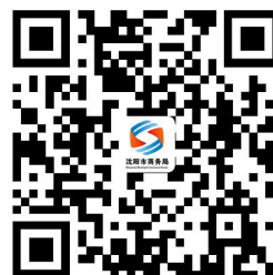
商务权力事项清单