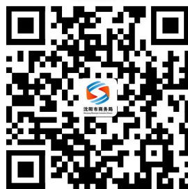
境外投资开办设立分支机构备案